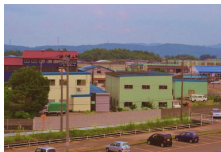
たくさん集まった工場(比角小学校の近く)