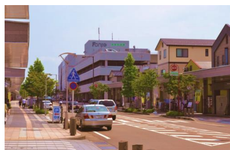
市の中心の商店がい(柏崎小学校の近く)