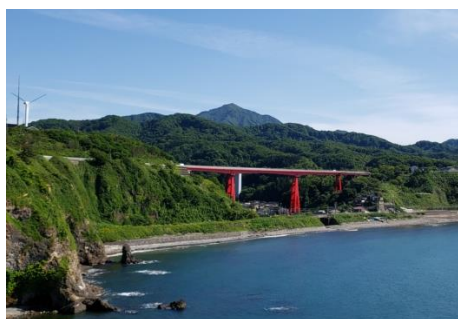
米山と米山大橋(米山小学校の近く)