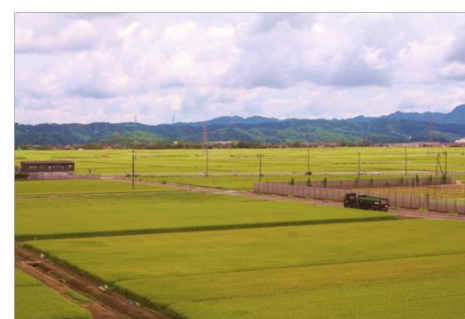
平地にひろがる水田(横原小学校の近く)