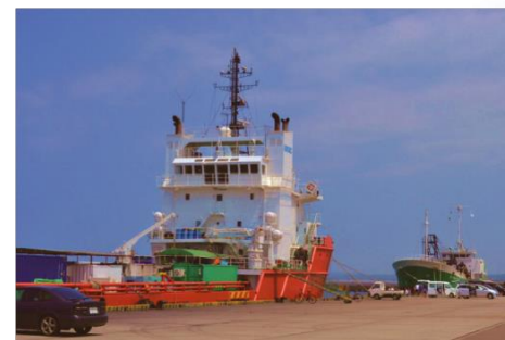
柏崎港(大洲小学校の近く)